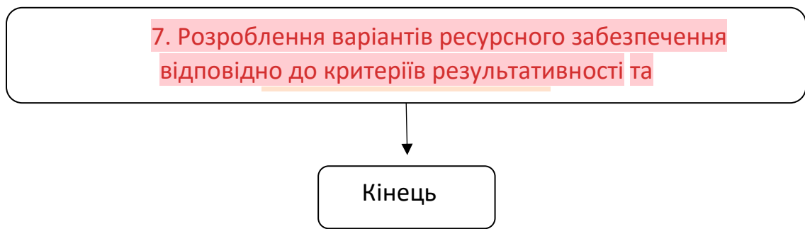
Рис. 1.3 – Алгоритм формування і ресурсного забезпечення підприємства ( www.intellect21.nuft.org.ua ) у сучасних умовах

На сучасному етапі успішне ресурсне забезпечення підприємства є важливим для досягнення стратегічних пріоритетів і його стабільного розвитку. Забезпечення ресурсами стає особливо важливим у конкурентному середовищі, де підприємствам потрібні концептуальні рішення в галузі управління.