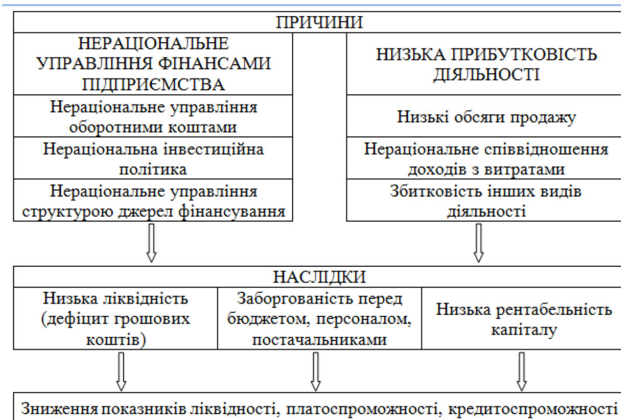
Рис. 3.1 – Основні причини зниження кредитоспроможності підприємства

В свою чергу, це має негативні наслідки для розміру власного капіталу, основним джерелом поповнення якого в процесі діяльності підприємства є нерозподілений прибуток. У разі отримання в результаті звітного періоду збитку, власний капітал підприємства починає зменшуватися, тим самим збільшується частка позикових фінансових ресурсів, які потребують своєчасного погашення.