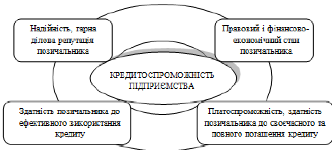
Рисунок 1.1 - Комплексний підхід до сутності категорії "кредитоспроможність підприємства" (розроблено на основі [34])

Відзначимо, що тлумачення кредитоспроможності підприємства має комплексний характер, що відображено на рис. 1.1.